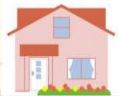
障害児通所 支援事業所