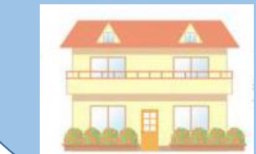
泉小学校跡地活用 障害者福祉施設など