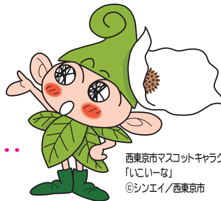
西東京市マスコットキャラクター 「いこいな」 ©シンエイ/西東京市