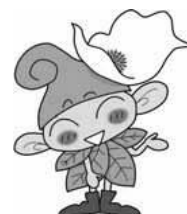
西東京市マスコットキャラクター 「いこいな」