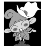
西東京市マスコットキャラクター 「いこいな」