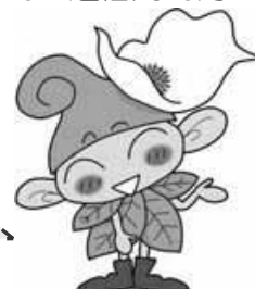
西東京市マスコットキャラクター 「いこいな」 ©シンエイ/西東京市