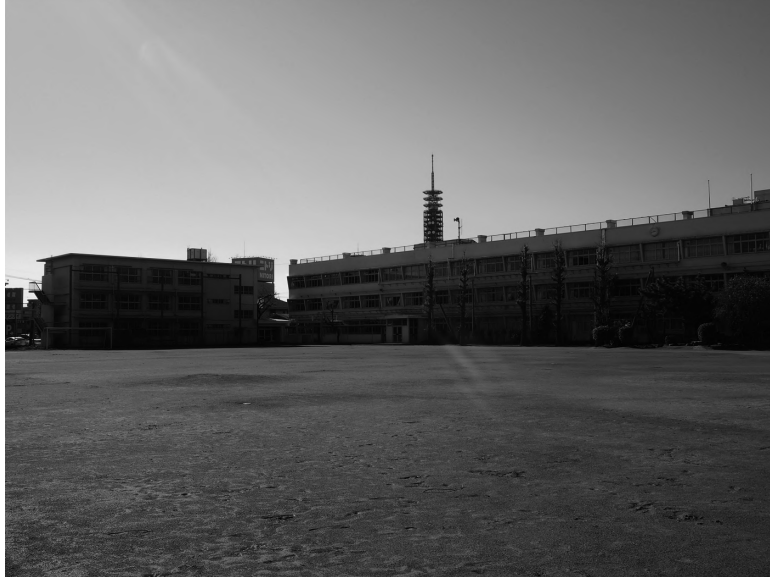
田無第三中学校（平成 31（2019）年 3 月）