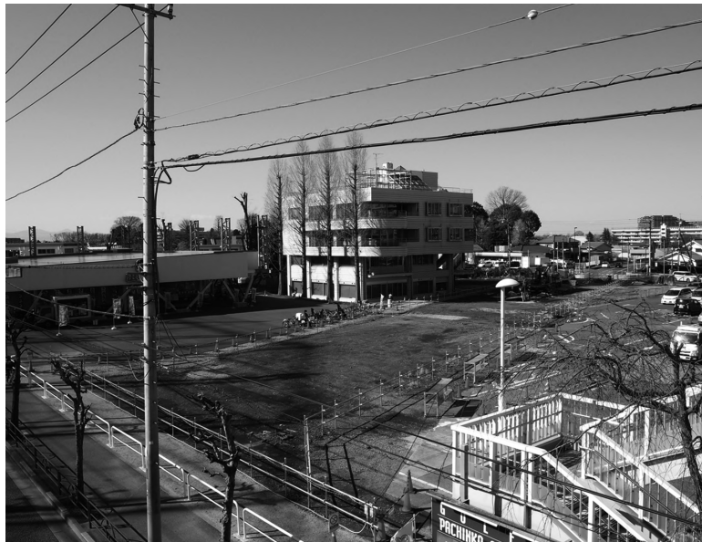
都市計画道路 3・4・26 号線の整備の様子（平成 31（2019）年 3 月）