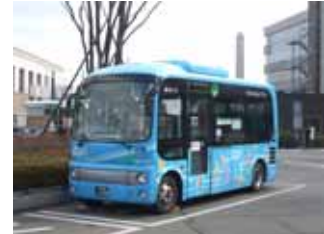
コミュニティバス（はなバス）