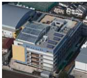
太陽光発電（青嵐中学校）

田無庁舎、青嵐中学校、けやき小学校など、8つの公共施設に太陽光発電システムを設置しています。今後も、施設改修や新築などの計画をする際には、太陽光発電システムの積極的な導入を検討します。また、高効率給湯器、LED照明等の導入についても併せて検討します。