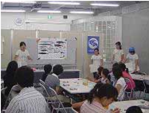
環境講座の様子 （エコプラザ西東京）