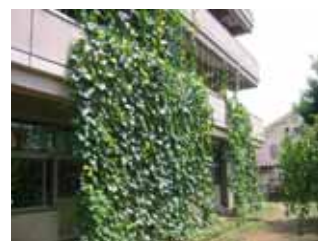
緑のカーテン (住吉小学校)