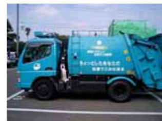
天然ガス車（ごみ収集車）

各種イベントで燃料電池自動車を始めとした低燃費車の展示を行うなどの情報提供を行います。