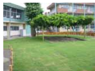
校庭の芝生 (東伏見小学校)