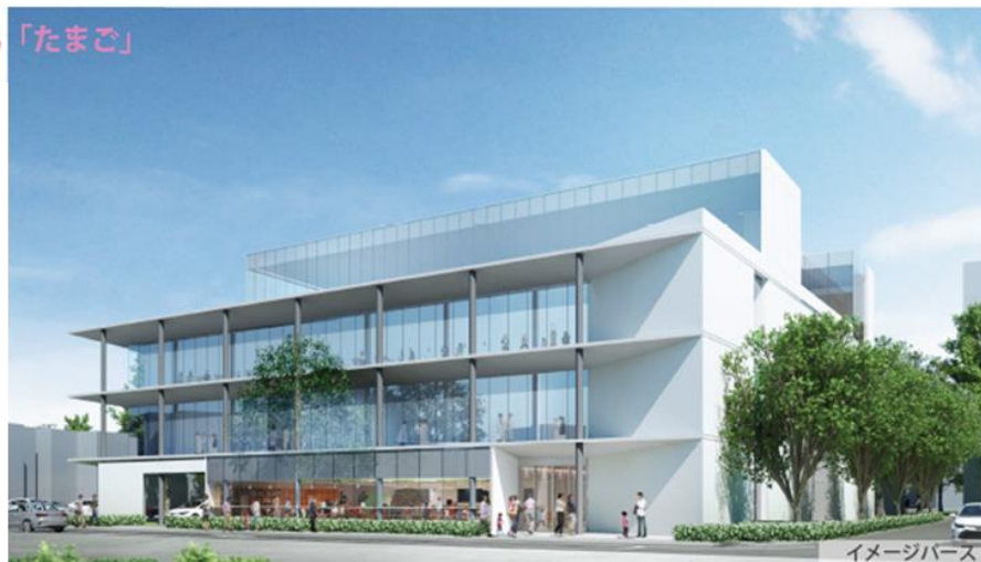
建物正面イメージ図