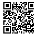
職員採用試験 申込ページ

保育士の資格証または取得見込みであることがわかる証明書の画像を添付してください。