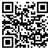
職員採用試験申込ページ

西東京市職員採用試験申込ページ より入力フォームに従って必要事項を入力してください。