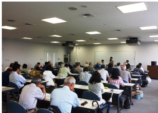
【写真】説明会の様子（左：7月5日の様子、右：6月28日の様子）