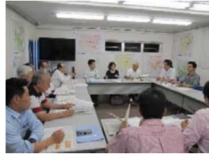
＜ワークショップの様子＞

第2回から第4回のまちづくり懇談会では、ワークショップ形式などにより、地区の現況・課題や今後の取り組みについて意見交換を行いました。これまで出されたご意見の一部をご紹介します。