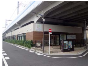
<高架下利用例> 左：保育所（民間） 右：駐輪場