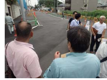
<石神井公園につながる道路整備状況を見学>