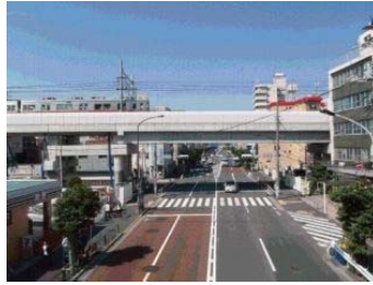
高架化のイメージ

一般的に高架化される場合、整備のための用地が必要となり、高架化した後は、道路として整備されることが多いです。