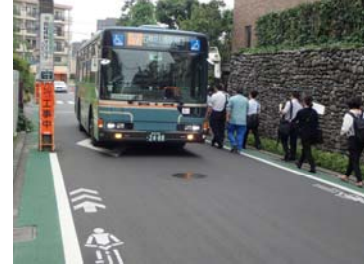
<石神井公園につながるバス通りを見学>