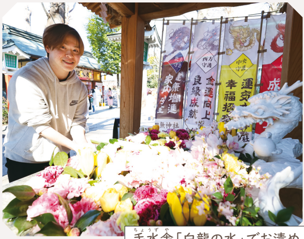
手水舎「白龍の水」でお清め