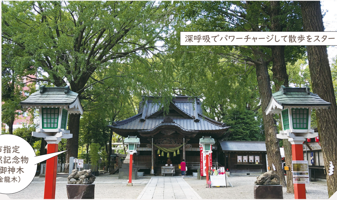
深呼吸でパワーチャージして散歩をスタート!