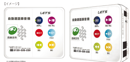
自動通話録音機イメージ図