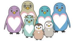
東京都里親制度普及啓発キャラクター「さとぺん・ファミリー」

人まで・申込順) 申 9月17日(金)午前10時から電話で下記へ ▶子ども家庭支援センター ☎042-425-3303