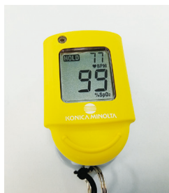
パルスオキシメーター