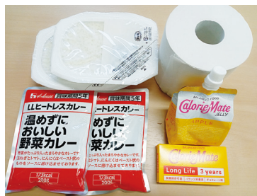
配布物のイメージ