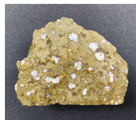
東京都の県の石「無人岩(むにんがん)」、標本の幅約6cm

3月20日(祝)からの春の特別企画展では、それらの標本を展示予定です。自分と関係がある都道府県の地学標本をきっかけとし、自分が暮らしている地球の成り立ちに目を向けてみてください。