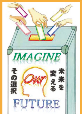
令和2年度明るい選挙ポスターコンクール出展作品 西東京市立田無第四中学校3年生の作品

西東京市長選挙は、1月31日(日)に告示され、2月7日(日)が投票日です。これからの西東京市を託す人を選ぶ大切な選挙です。貴重な一票を大切に必ず投票しましょう。 ▶選挙管理委員会事務局 ☎042-420-2801