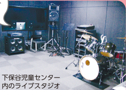
下保谷児童センター 内のライブスタジオ