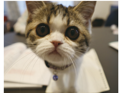
2等「もうお勉強やめて?」