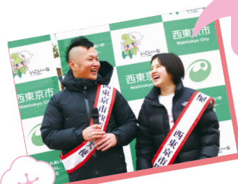
12月21日任命 西東京リレー マラソンにて