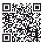
西東京市 動画チャンネル