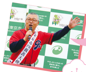
12月21日任命 西東京リレー マラソンにて

旧保谷市出身で、市内の小学校及び中学校を卒業後、1992年に落語家初代林家木久蔵師に入門。同年、前座となる。前座名は「久蔵」。1995年には二ツ目昇進、そして2006年に真打昇進し、現在はパワフルな落語のほか、講演、司会(イベント、結婚式、カラオケ大会など)リポーター、ナレーター、役者、歌手、MC、DJ、バス旅行の盛り上げ、引越しの手伝い、中学の数学のみの家庭教師など…全国で活躍中。