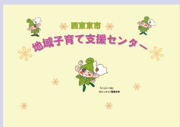
▲この表示画面が目印です