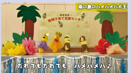
▲楽しい人形劇の様子 ※「みんなで歌おう!人形シアター「南の島のハメハメハ大王」より