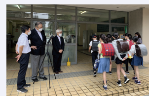
児童を迎える様子 (左から学校長・市長・教育長)