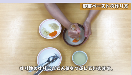
▲野菜をすりこぎですりつぶす様子 ※「これからはじめる離乳食 野菜ペースト編」より