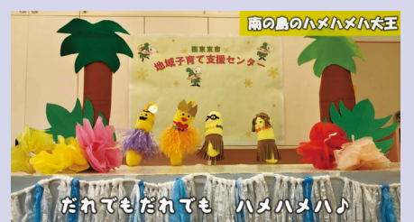
▲楽しい人形劇の様子 ※「みんなで歌おう! 人形シアター「南の島のハメハメハ大王」より