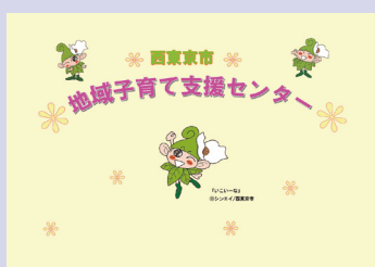
▲この表示画面が目印です