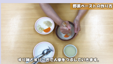
▲野菜をすりこぎですりつぶす様子 ※「これからはじめる離乳食 野菜ペースト編」より