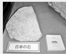
新潟県糸魚川市産の翡翠(左)とミャンマー産の翡翠(右)

オンファス輝石が混じったものが多いようです。本翡翠の他に「〜翡翠」と呼ばれる石も売られていますが、これは石英・霞石・緑閃石・ざくろ石などであり、翡翠を購入する際には注意が必要です。多摩六都科学館には本翡翠の展示がありますのでぜひひ見に来てください。