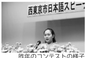
昨年のコンテストの様子

内 市内の外国人による日本語スピーチ、外国につながる小・中学生による日本語メッセージ、インドネシア舞踊など 問 日本語スピーチコンテスト2016実行委員会(西東京市多文化共生センター内・☎042-461-0381) ◆文化振興課(☎042-438-4040)