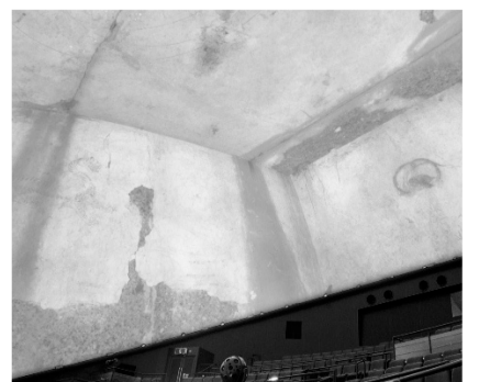
古墳内部を迫力の全天映写で体感!