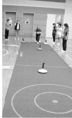
カーペット上でストーンを滑らせるユニカール