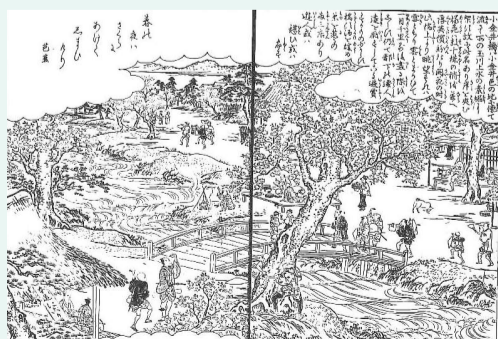
「江戸名所図絵」小金井橋の図 (『田無市史 第3巻通史編』より転載)