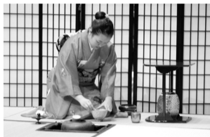
茶道のお点前の様子

ス・Eメールまたは持参 ※詳細は、現在公開中の市HPまたは 9月1日(木)から公共施設で配布するチ ラシをご覧ください。 □共催 西東京市民文化祭実行委員会 ◆文化振興課(☎042-438-4040)