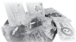
一店逸品! お茶とお菓子コース