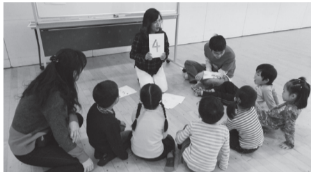
当日の子どもたちの様子

所文化振興課「3/12英語で楽しく」係へ ※Eメールは件名に「3/12英語で楽しく」と記入 ※必ず保護者が送迎してください。 共催 NPO法人西東京市多文化共生センター(NIMIC) 文化振興課 ☎042-438-4040 ✉ bunka@city.nishitokyo.lg.jp