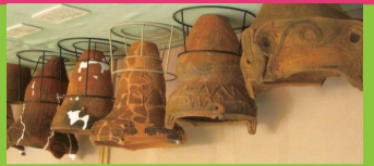
下野谷遺跡から出土した土器など市内の郷土資料を保存・展示しています。