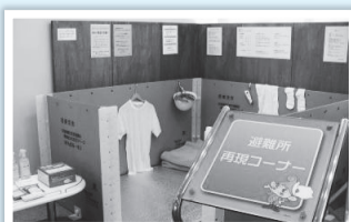
避難所再現コーナー

防災意識の高揚と防災行動力の向上を図るコミュニティ活動や学習の場として活用できるコーナーです。各種防災情報に関するパネルや家庭で役立つ防災用品・非常食などの展示、災害発生時に実際に使用する物で避難所を再現したコーナーがあります。また、タッチパネルを操作しながら、「いこいな」と一緒に防災をクイズ形式で学べる「防災Q&A」や、防災に関するゲームもでき、子どもでも楽しみながら学習できます。