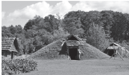
特別史跡 御所野遺跡