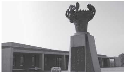
馬高縄文館(特別史跡 馬高・三十稲葉遺跡)