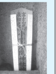
石祠に祭られたお札