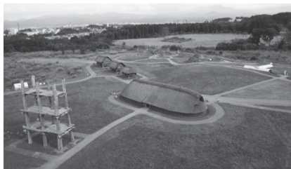
特別史跡 三内丸山遺跡