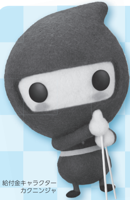
給付金キャラクター カクニンジャ

平成26年4月からの消費税率の引き上げに伴い、今年度も所得の少ない方への負担を軽減するために、暫定的・臨時的な措置として臨時福祉給付金の給付を行います。