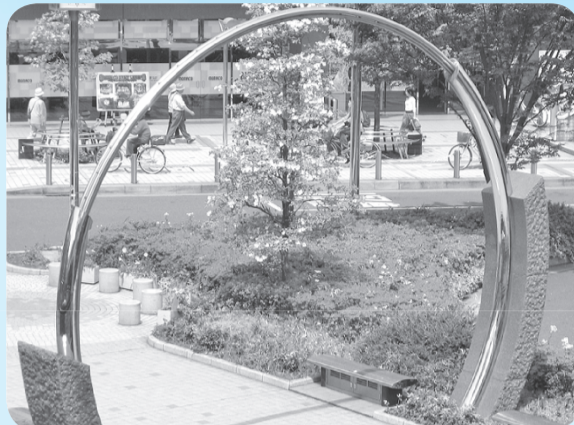
平和のリング(田無駅北口)