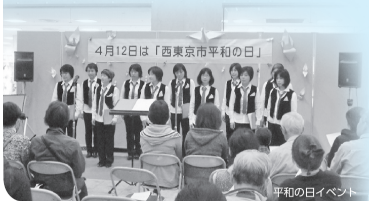
平和の日イベント

□共催 非核・平和をすすめる西東京市民の会 ◆協働コミュニティ課保(☎042-438-4046)