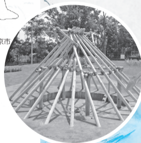
復元住居(下野谷遺跡公園)

A5 下野谷遺跡公園(東伏見6-4)の地下には遺跡がそのまま保存されていて、地上には当時の家の骨組みを示すモニュメントなどがあります。また、西原総合教育施設にある郷土資料室(☎042-467-1183 ※月・火曜日休み)では、出土した土器や石器などを見ることができます。