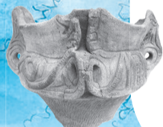
出土した縄文土器