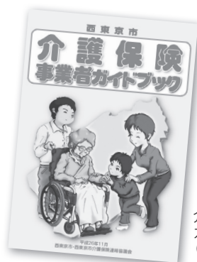
介護保険事業者ガイドブック(改訂版)