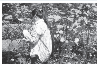
下野谷遺跡公園の「からむし」

ある福島県の昭和村から、特別に株分けしていただいたものです(現在は在地の種と一部混交してしまいました)。これからどんどん成長し、夏直前には糸を採ることができるようになりますので、大切に見守ってくださいね。