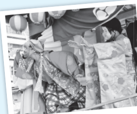
軽快な田無ばやしの音色

と呼ばれる初夏、7月15日には青梅街道に、にぎやかなお囃子の音と威勢の良い神輿をもむ声が響きました。天王様のお祭りです。今も続くこのお祭り、今年も7月12・13日に行われます。市の無形文化財に指定されている「田無ばやし」とお神輿に、夏の元気をもらいに掛掛けてみませんか。