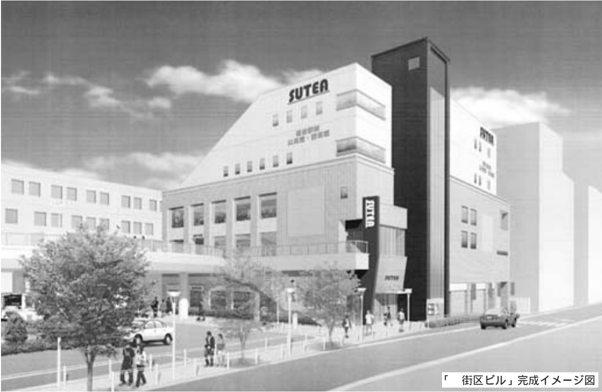
「 街区ビル」完成イメージ図

街区ビルは、地上5階地下1階で延べ床面積約7,950㎡の鉄骨鉄筋コンクリート造の建物です。ビルは時代に見合ったデザインで、かつ落ち着いた色調を採用しています。