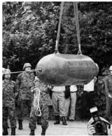
60年の時を超えて掘り出された不発弾 (昨年、7月10日 東伏見にて)

西東京市は、平成13年1月21日に「西東京市平和推進に関する条例」を制定し、4月12日を「西東京市平和の日」と定めています。昭和20年のこの日、B29爆撃機の空襲により、この西東京市域において多くの尊い命が瞬時に失われました。田無駅周辺では、お昼どき