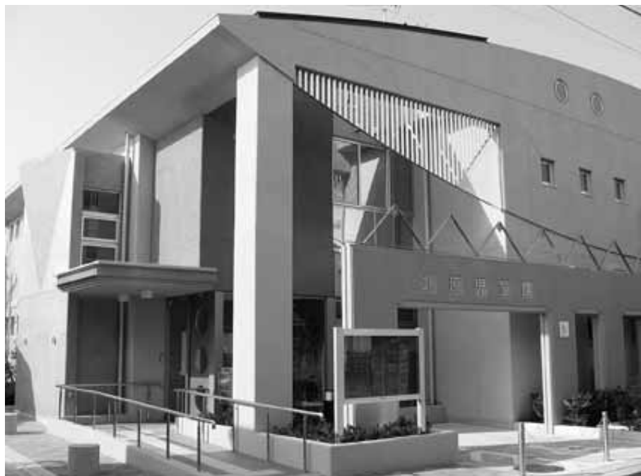
建替えられた北原児童館