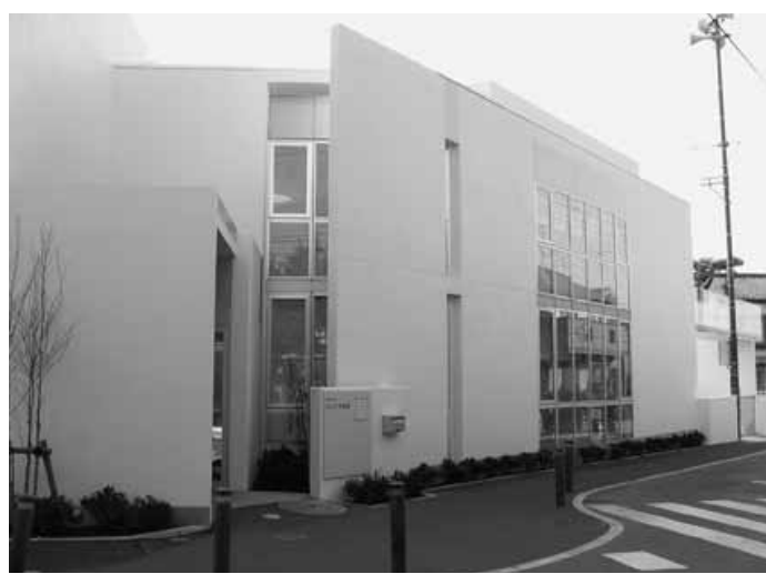
みどり保育園(公設民営保育園)

みどり保育園の建て替え工事が完了し、4月1日から、市では初となる公設民営保育園として新しいスタートします。新園では、0歳児の新規受け入れ、1・2歳児の受け入れ児童数の拡大および午後8時までの延長保育を行うとともに、地域の子育て家庭に対する支援として一時保育事業を新たに実施し、地域の皆さまから愛される保育園をめざします。 保育園 ☎内線1531 : 田無庁舎