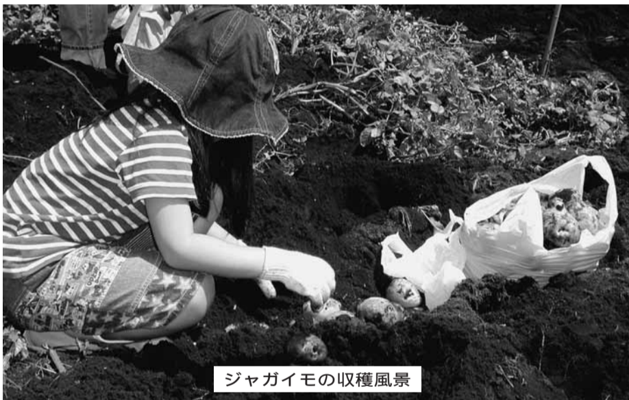
ジャガイモの収穫風景

潤いある緑地空間としての農地を保全するとともに、市民が自らの手で野菜づくりに取り組めるように市民農園・家族農園が設置されています。生産の喜びと農業に対する理解を深めて、健康的で豊かな生活にお役立てください。 利用者をお次のとおり募集します。 産業振興課(☎区内線141、1442)