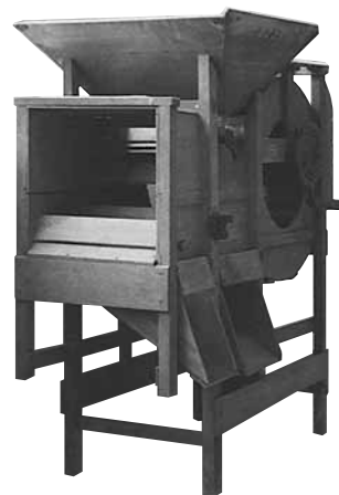
とうみ唐箕です。脱穀した稲等を、実ともみからに分ける昔の道具です。