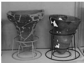
下野谷遺跡出土の土器

開室日 毎週水曜日～日曜日 午前10時～午後5時 (祝日も開室しています) 休室日 月・火曜日、年末年始 交通 田無駅北口徒歩18分、田無駅北口・ひばりヶ丘駅南口より西武バス(田44系統)で、「西原グリーンハイツ」下車徒歩3分 問合せ 上記郷土資料室へ 社会教育課(☎☎内線2712)