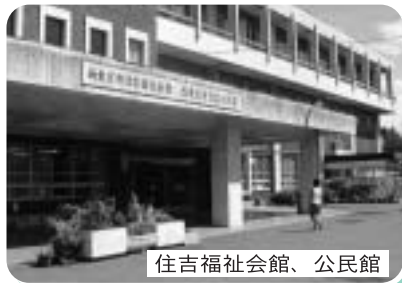
住吉福祉会館、公民館