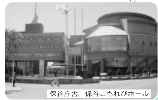
保谷庁舎、保谷こもれびホール