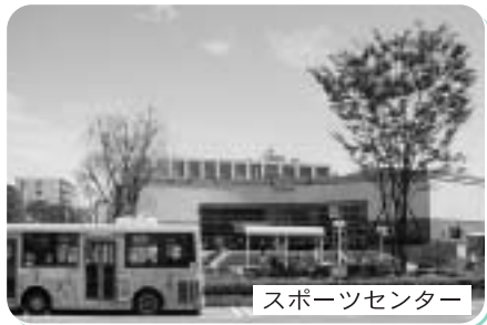
スポーツセンター