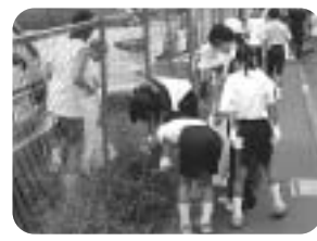
ひばりヶ丘駅南口で清掃活動中のひばりが丘中学校の生徒の皆さん