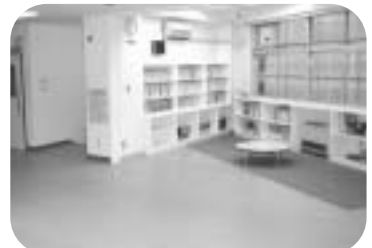
明るく広々とした多目的ホール

田無柳沢児童センターの改修工事が完了し、8月20日(金)に開館しました。新しい児童センターには、広い多目的ホール、視聴覚室、きれいな遊戯室ができました。また、夜間・休日開館を実施しています。新しくなった児童センターに、お友だちやご家族で遊びに来ませんか。