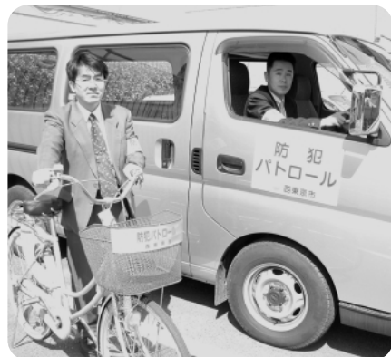
職員もパトロールをしています！

市民防犯活動への補助 防犯活動を行う団体が必要な用具を購入する場合に、一定額を限度に補助します。申請の方法などについては後日市報等でお知らせします。 駅頭での防犯啓発活動 市内5駅または犯罪多発地点において、市の職員、警察、防犯協会など関係団体により、防犯啓発活動を行っています。 職員パトロール 市の職員が業務で市内を移動するとき、防犯の視点でパトロールをします。公用車に「防犯パトロール」と表示し、また「防犯」の腕章を着用します。 防犯掲示板の設置 小学校区ごとに防犯掲示板を新設し、警察からの防犯情報などを、皆さんにお伝えします。 市民パトロール養成講座 市民の自主的な防犯活動のあり方やパトロールの実践についての講座を行います。