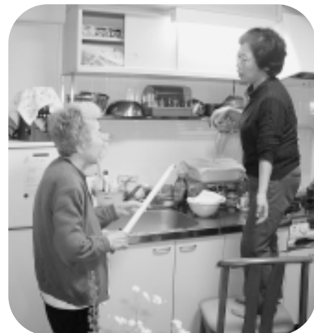
蛍光灯、明るくなってよかったね (取り替えを行う協力員さん)