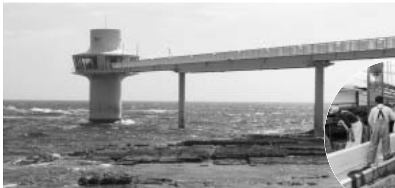
東洋一の規模を誇る海中展望塔