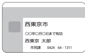
「券面記載事項」 ・交付地市区町村名 ・有効期限 ・氏名

の写真を貼付したものに限り、提示が必要になります。市民課(保)内線1461、(保)内線2131)