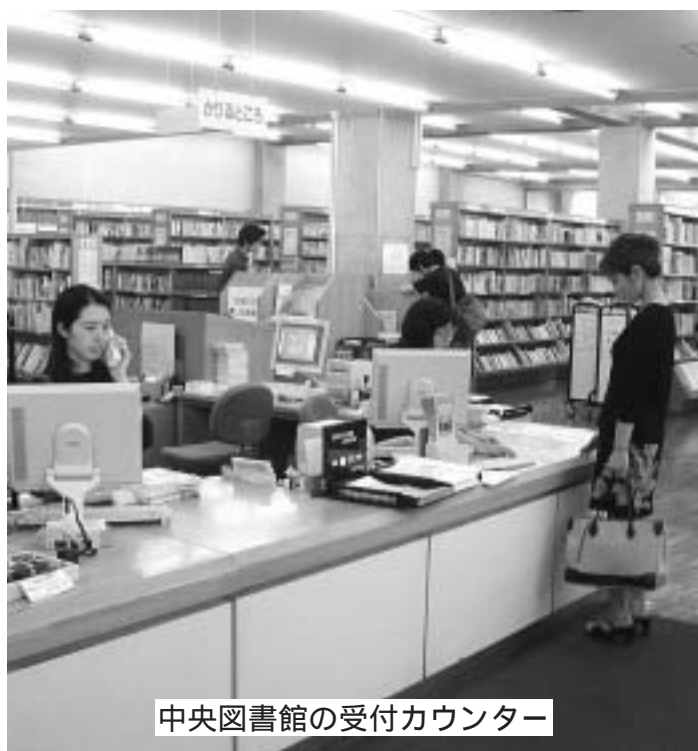
中央図書館の受付カウンター

11月8日、9日に開催の市民まつりに出店する団体(食べ物・物品・無料配布・PRなど)を募集します。