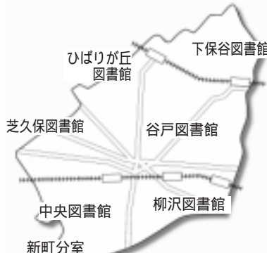
図1. 図書館電話サービス利用方法

サービスの利用方法は、館内利用者用検索コンピュータまたは、インターネットから西東京市図書館ホームページにアクセスし、自分の電子メールアドレスを登録してください。予約連絡方法で「メール」を選択した場合は、登録されたメールアドレスへ通知します。