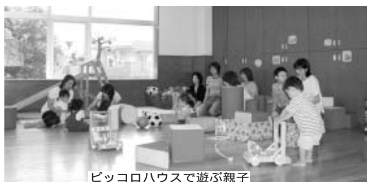
ピッコロハウスで遊ぶ親子

ピッコロハウスとビデオルーム ピッコロハウスは、0歳から3歳の乳幼児と保護者の交流の場です。すべり台、トンネル、積み木、ブロック等の遊具があります。お昼寝や授乳の部屋もあります。 ビデオルームには、昔話や童話、アニメ等のビデオテープがあり、幼児から中学生まで利用できます。 開設日 火曜日から日曜日(月曜日が祝日の場合は開設し、火曜日がお休みになります) 開設時間 午前10時から午後5時(ビデオルームは正午から午後1時は利用できません) 問合せ 子ども家庭支援センター(☎51・0600 FAX 51・0612) 7月1日から通話開始