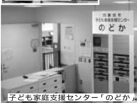
子ども家庭支援センター「のどか」

市は、子育ての不安や悩みを抱える子育て家庭を支援していくため、7月1日(火)に子ども家庭支援センター「のどか」をコール田無3階ビデオルーム内に開設します。 人は、誰もが「幸せに楽しく、自由で、平和に生きたい」という願いを持っています。市では、一人ひとりかけがえのない大切な存在であることを踏まえ、人と出会い、育ちあい、支えあう子育て支援事業を行ってまいります。 子育て支援課(田無庁舎5F内線1521)