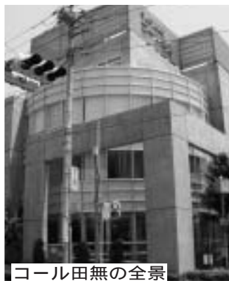
コール田無の全景

子育て支援事業 子育てを支えていくために、講座や情報提供を行います。 子育て講座 あそびの広場 子育て情報の提供 子育てサークル等の支援